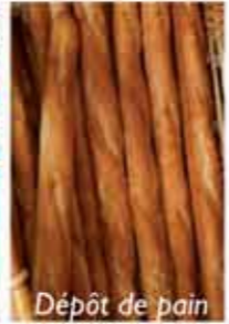
Dépôt de pain