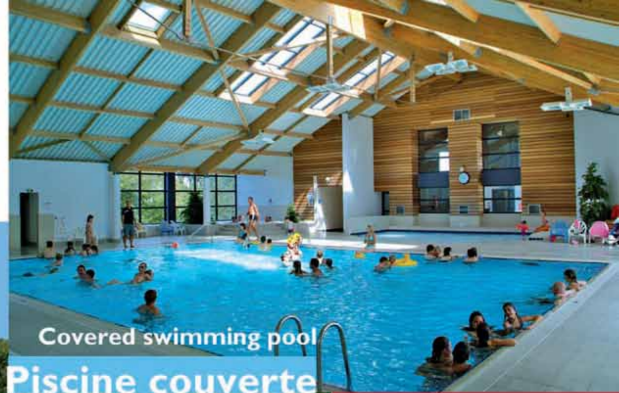
Covered swimming pool