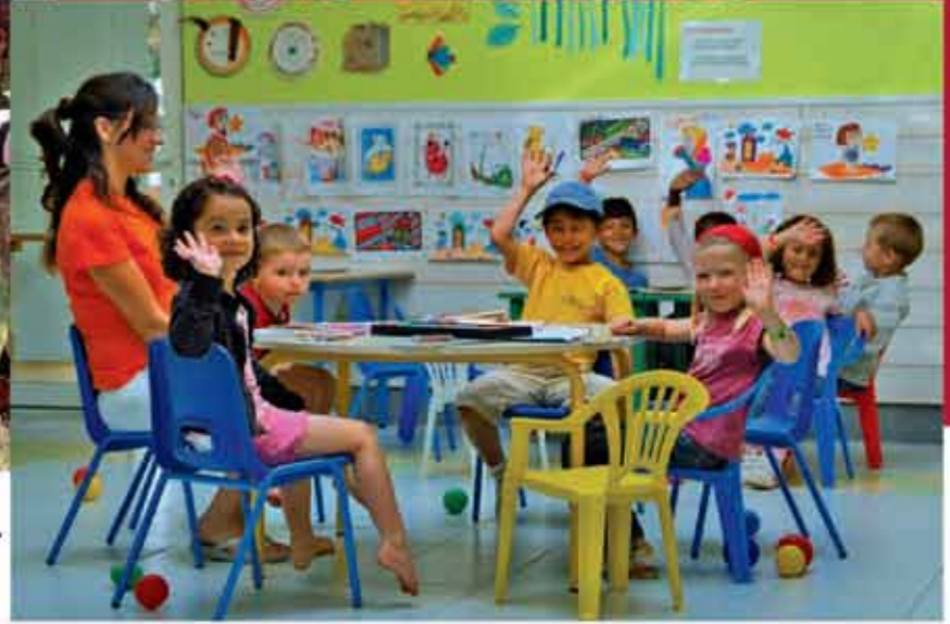
Clubs 'boutchou' et 'junior' du lundi au vendredi en saison. Children's 'boutchou' and 'junior' clubs from Monday to Friday in high season.