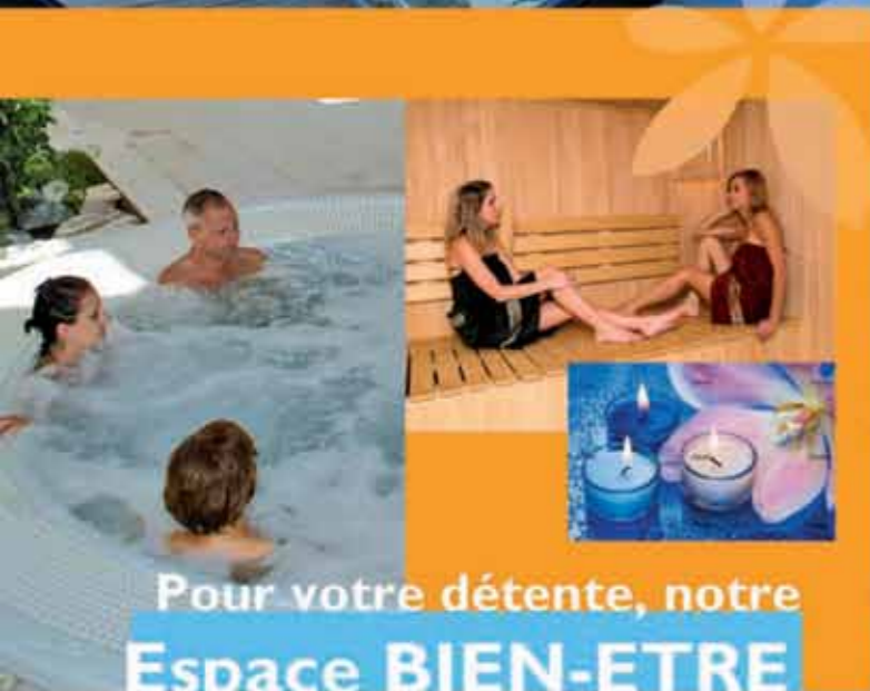
Pour votre détente, notre Espace BIEN-ETRE