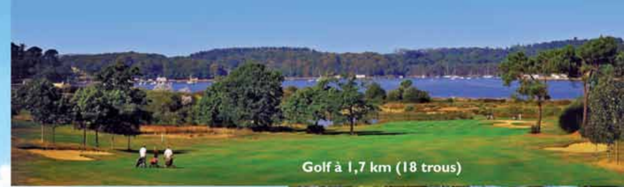
Golf à 1,7 km (18 trous)