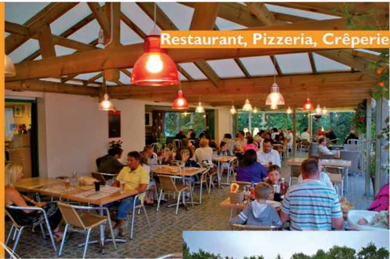
Restaurant, Pizzeria, Crêperie