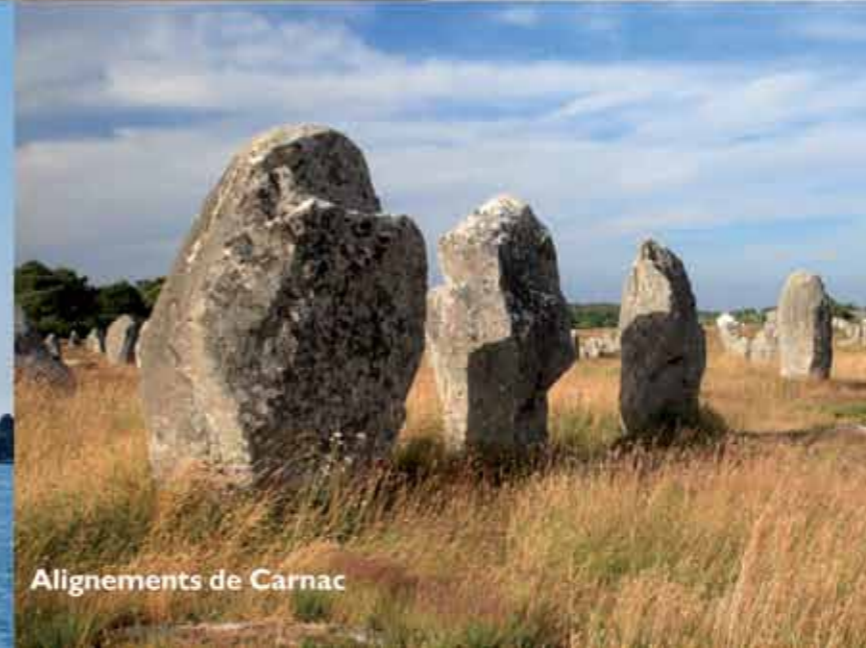
Alignements de Carnac

FR - Le camping Mané Guernehué est idéalement situé dans le Golfe du Morbihan, son climat tempéré, doux en hiver, agréable en été, propice pour de nombreuses excursions :